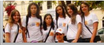
Atividades na Praça João Pinheiro