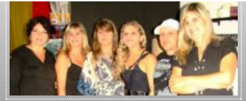
Inauguração da Loja Woodstock