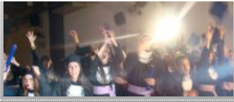
Formatura da Faminas